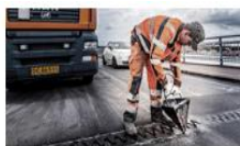
Broer og fræsning