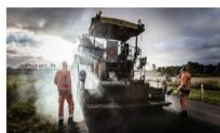
Asfalt og OB