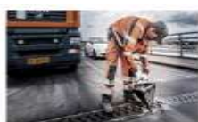
Broer og fræsning