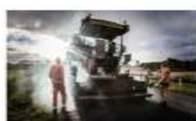
Asfalt og OB